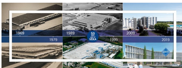
Bild 1: 1969 begann im Münsterland eine einzigartige Unternehmensgeschichte. Heute arbeiten 6.000 Mitarbeiterinnen und Mitarbeiter in der VEKA Gruppe, die weltweit mit 41 Standorten vertreten ist.

Ansprechpartnerin: Barbara Oermann · Abdruck honorarfrei Belegexemplar erbeten an: VEKA AG, Abt. Presse- und Öffentlichkeitsarbeit